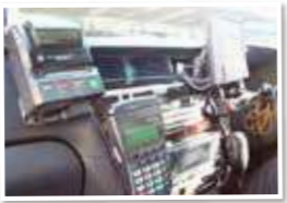
▲車内には領収書発行機やカード決済用の機械なども付いていますが操作は簡単