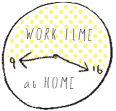
▲勤務時間は自由に選択可能。無理なく働けるワーキングスタイルで育児との両立もしやすいです